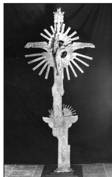
Le sculture di "Gineba".

"Gineba" ha esposto in numerosi musei e mostre di città italiane ed estere: da Verona a Ravenna, da Pordenone a Monaco di Baviera. Tra le opere più originali a cui ha dato vita vanno ricordati gli strumenti musicali costruiti con plexiglass, legni, corde, acciai in un multiforme lavoro di mente e di mano. Sempre alla ricerca di novità e mai appagato, "Gineba" sonda