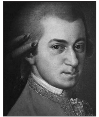
Wolfgang Amadeus Mozart.

A partire dalle 17,30 Microcinema trasmetterà via satellite in diretta e in esclusiva assoluta il "Don Giovanni" a tutte le sale collegate, oltre 100 in Italia, 2 in provincia di Brescia, fra cui il Gloria di Montichiari. Una occasione da non perdere.