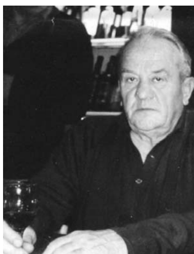
Conzadori (Cicetti) 1° anniversario